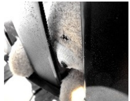
Aliénation - photographie

Reproduction des œuvres interdite sans l'autorisation de l'artiste © Julie Turconi