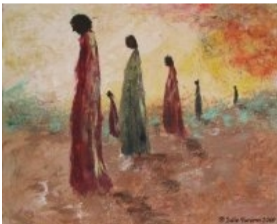
Exode – techniques mixtes