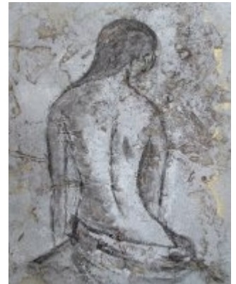
Chimère – techniques mixtes