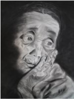
Contemplation - fusain

Julie Turconi Photographie, peinture, fusain