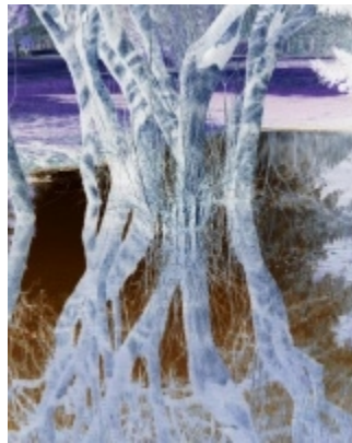
Fantasmagorie – photographie